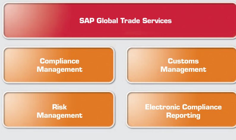
Die 4 Komponenten der SAP GTS-Lösung.

terized Transit System) auch das elektronische ATLAS-Verfahren (Automatisiertes Tarif- und lokales Zoll-Abwicklungs-System) unterstützt, welches ab dem 01. Juli 2009 für alle exportierenden Unternehmen in Deutschland zur Pflicht wird. Darüber hinaus ist es bereits für weitere elektronische Zollabwicklungssysteme in Europa, USA und Australien zertifiziert.